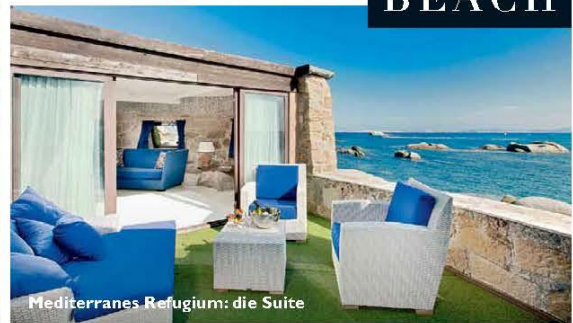
Mediterranes Refugium: die Suite