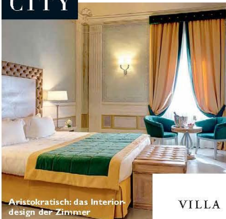
Aristokratisch: das Interior design der Zimmer